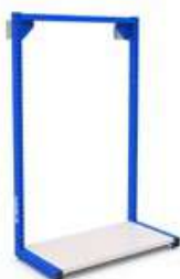
Система хранения SORTEX 1075-1 Base Артикул 520-1100-00