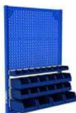
Система хранения SORTEX 1495-S №1-1 Артикул 520-0101-00