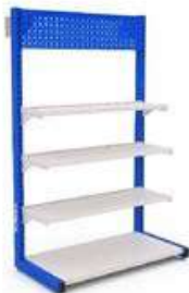
Система хранения SORTEX 1495-1 №1-1 Артикул 520-1151-00