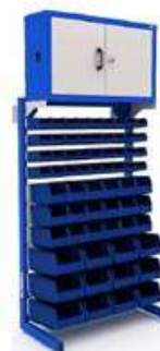
Система хранения SORTEX 1495-1 №1-6 Артикул 520-1156-00