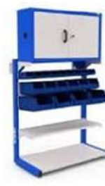
Система хранения SORTEX 1075-1 №1-6 Артикул 520-1106-00