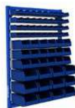
Система хранения SORTEX 1495-S №1-2 Артикул 520-0101-00