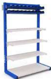
Система хранения SORTEX 1495-1 №1-2 Артикул 520-1152-00