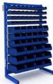
Система хранения SORTEX 1495-1 №1-4 Артикул 520-1154-00