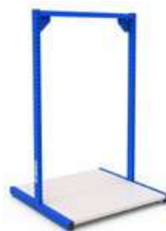
Система хранения SORTEX 1075-2 Base Артикул 520-2100-00