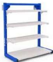
Система хранения SORTEX 1075-1 №1-1 Артикул 520-1101-00