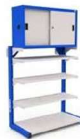
Система хранения SORTEX 1075-1 №1-5 Артикул 520-1105-00