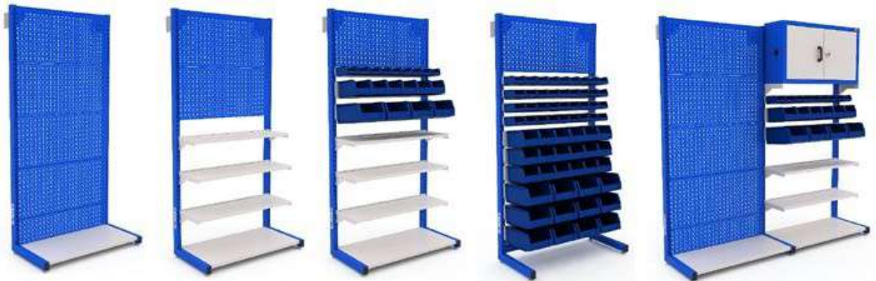
Система хранения SORTEX 1915 №1-1 Артикул 520-1201-00