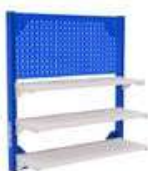
Система хранения SORTEX 1075-S №1-2 Артикул 520-0101-00