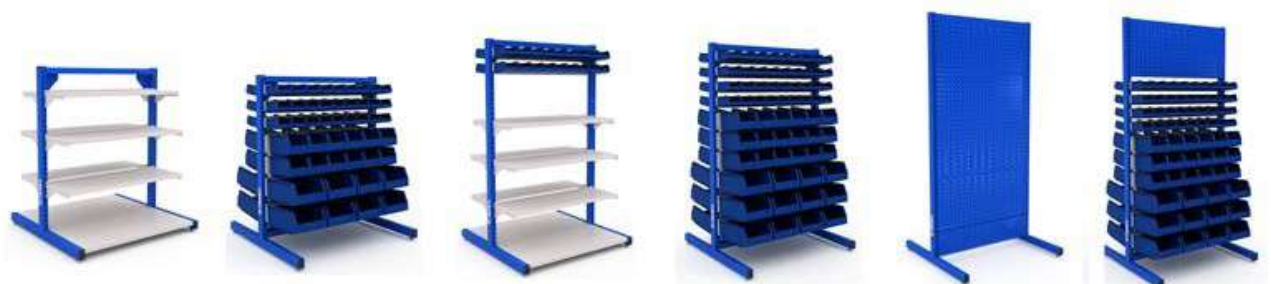
Система хранения SORTEX 1075-2 №1-1 Артикул 520-2101-00