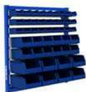
Система хранения SORTEX 1075-S №1-1 Артикул 520-0101-00