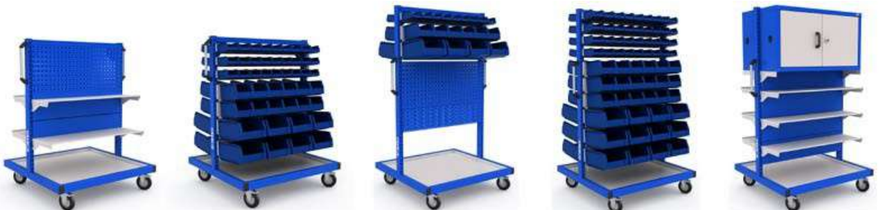
Система хранения SORTEX 1075-M №1-1 Артикул 520-3101-00