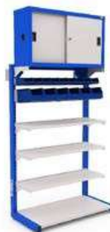
Система хранения SORTEX 1495-1 №1-5 Артикул 520-1155-00