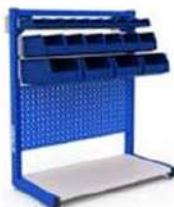
Система хранения SORTEX 1075-1 №1-3 Артикул 520-1103-00