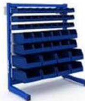
Система хранения SORTEX 1075-1 №1-4 Артикул 520-1104-00