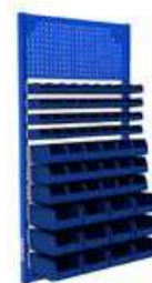
Система хранения SORTEX 1915-S №1-2 Артикул 520-0101-00