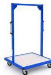
Система хранения SORTEX 1075-M Base Артикул 520-3100-00