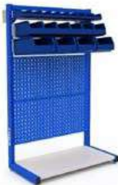
Система хранения SORTEX 1495-1 №1-3 Артикул 520-1153-00