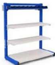
Система хранения SORTEX 1075-1 №1-2 Артикул 520-1102-00