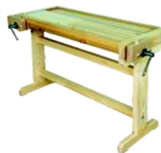
« ( ) »