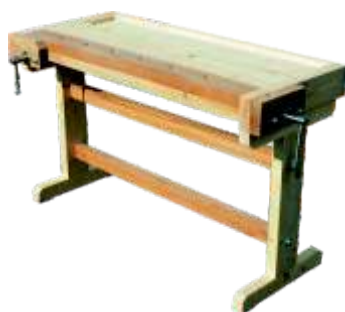
( « » )