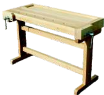
« ( ) »