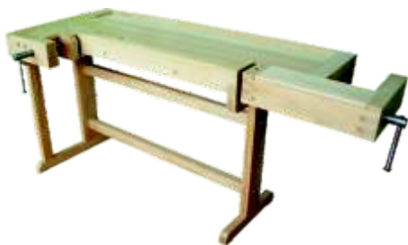
« ( ) »