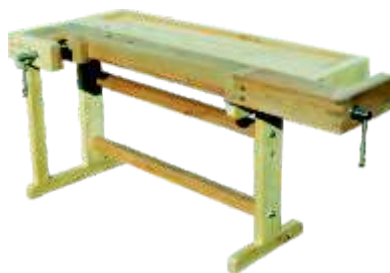
« ( ) »