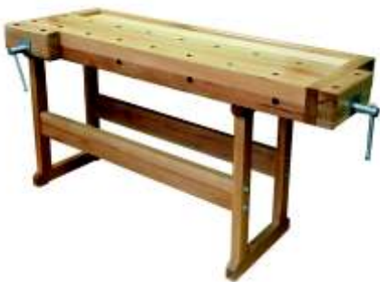
« ( ) »