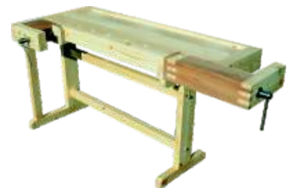
« ( ) »