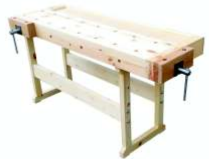
« ( ) »